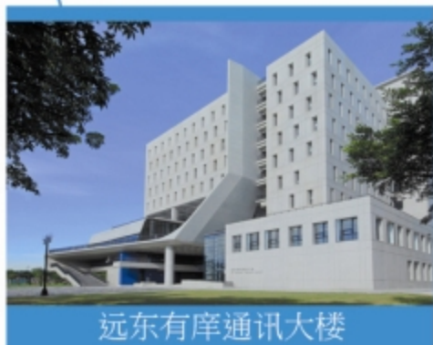
远东有庠通讯大楼