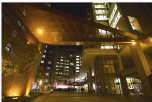
宿舍和乐学广场夜景