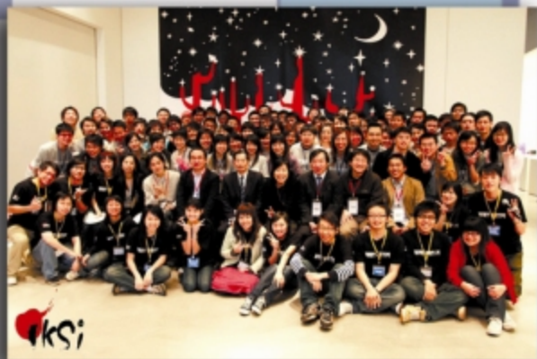
知识服务和创新研究中心