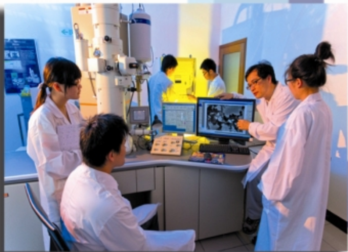
环境科技研究中心