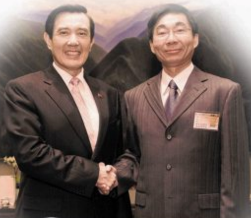
林志民教授(右)荣获中国工程师学会 2010年「杰出工程教授奖」