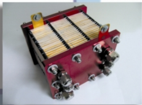
燃料电池研究中心