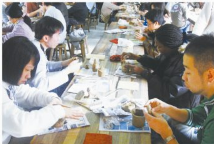
台湾文化体验营(陶艺雕塑)